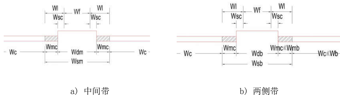
图 5.3.5 分车带

1 分车带按其在横断面中的不同位置及功能，可分为中间分车带（简称中间带）及两侧分车带（简称两侧带），分车带由分隔带及两侧路缘带组成（图 5.3.5）。